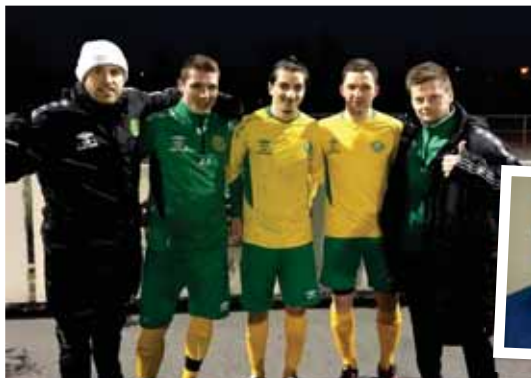
I STALLEN: Seniorene har blitt forsterket på både trener- og spillersiden i vinter.