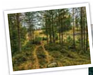
Om en utvidelse av Aussenfjellet Industriområde vedtas, vil dette strekke seg helt til Skedsmo kommunes grense og nær bebyggelsen på Leirsund.

Leirsund vel har sendt en henvendelse til Bulk for å